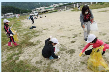
▲4年生～ゴミ拾い大作戦～