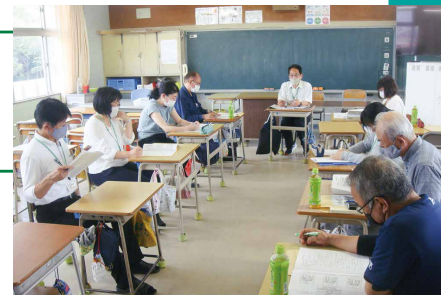
▲～学校運営協議会の様子～

目的・コンセプト 》「私たちの生活環境は私たちの手で進んで美しく整頓し、さらに工夫をしながらよりよい環境をつくる」を基本コンセプトとし、児童自らも環境のことを考え、時には地域の方からも学び、多くの方と関りをもち豊かな心も育む 清掃活動を企画し実施しています。