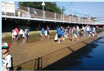
▲～堀川クリーン作戦～