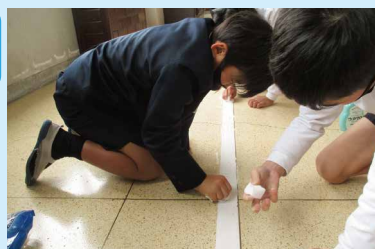
▲6年生～パワーアップ大作戦～