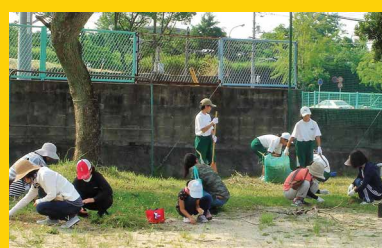
▲親子ふれあい作業