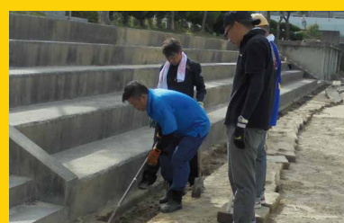
▲父親の会 溝の土あげ