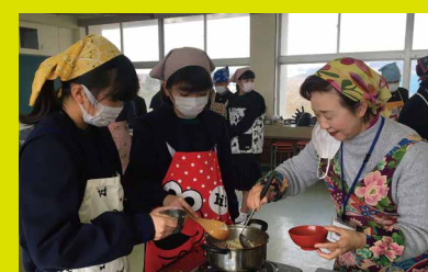
▲家庭科ボランティア