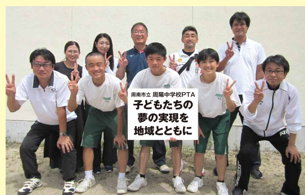
周南市立 周陽中学校PTA 子どもたちの夢の実現を地域とともに