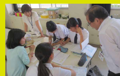
▲自学サポートプラン