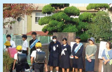
▲にこにこあいさつプラン