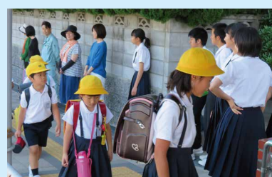
▲にこにこあいさつプラン