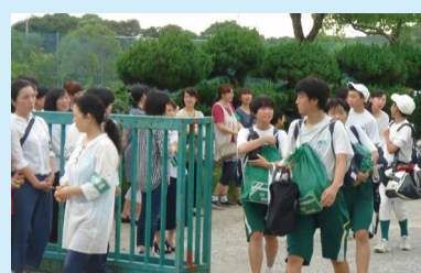
▲地域のおじさんおばさん運動